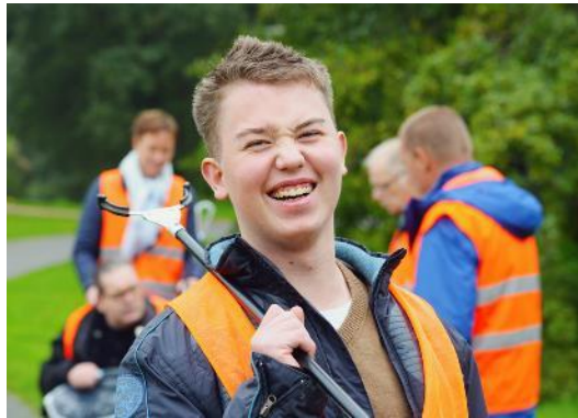
Meedoen in de wijk